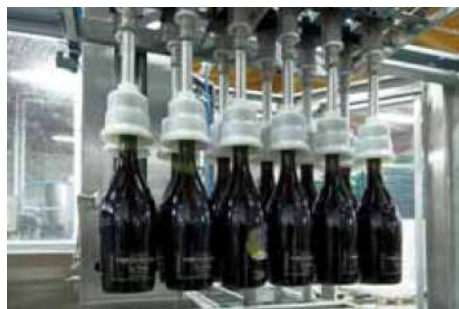
Tête de prise multiformats