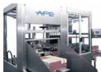
Magasin cartons avec capacité jusqu'à 75 pièces

Les cartons ouverts au-dessus peuvent sortir pour permettre la suivante introduction de la ruche.