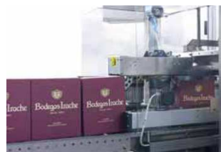
Unité d'application de ruban pour la fermeture des bords supérieurs et inférieurs