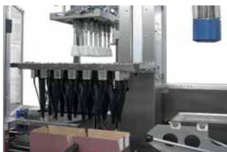
Entonnoirs de centrage pour cartons avec ruches préintroduites